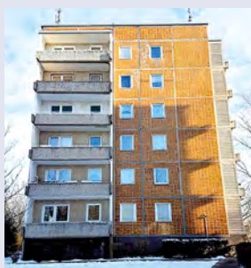
Vor der Sanierung

Als neue Aufzugsanlage wurde das moderne System „Gen2 Life“-Modell mit energieeffizienter Technologie sowie benutzerfreundlicher eCall App und informativem eView-Kabinendisplay vom Hersteller OTIS gewählt. Die Planung der Balkon- und Aufzugsanlagen übernahm das Magdeburger Ingenieurbüro für Tragwerksplanung TRAKON Lenz GmbH.