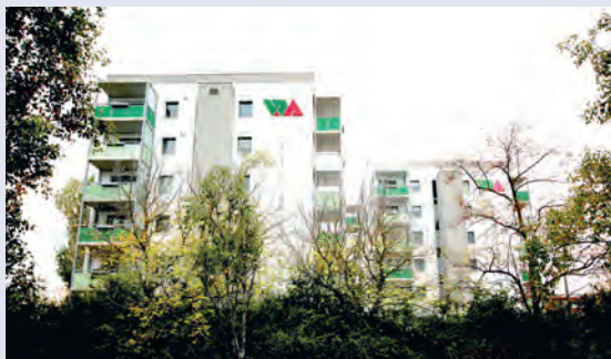
Fernansicht mit Aufzugstürmen u. Logo der WOBAU