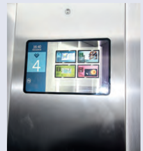
eView-Display im Aufzug