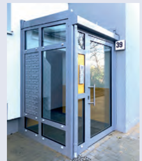
Eingang mit Aufzugsturm