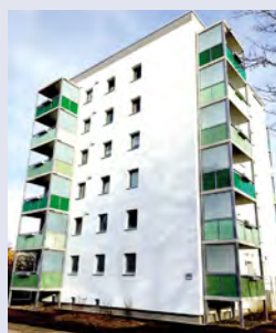
Nach der Sanierung