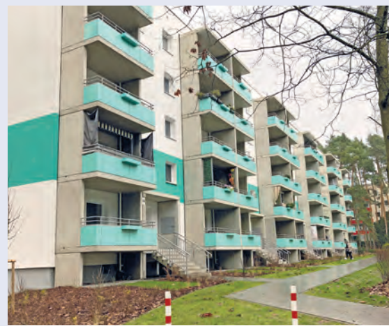
Wohngebäude Nr. 26-34 nach der Sanierung