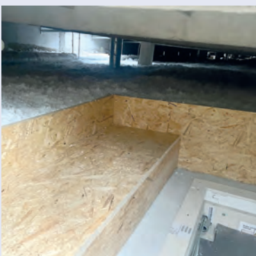
Dachboden mit Einblasdämmung