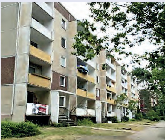
Wohngebäude Nr. 26-34 vor der Sanierung

In 22 „Rückzieher-Wohnungen“ wurde ebenfalls das Renovierungspaket ausgeführt, jedoch ohne die Renovierung der Bäder.