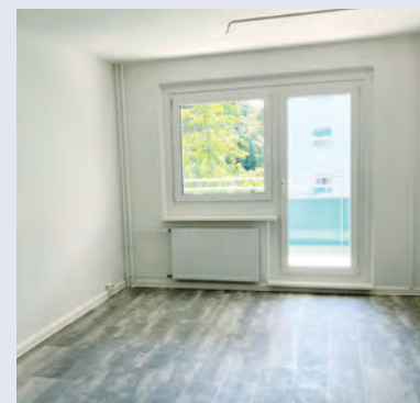
komplett saniertes Zimmer